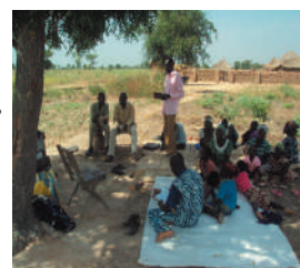
Eglise à Fianga, Tchad

Depuis que l'évangéliste pécheur est parti, il n'y avait plus de moyen pour louer un local de réunions. Cependant, un membre, qui a été un pilier de l'Eglise à Pala, Tchad, s'est repenti et a offert une parcelle de son terrain pour construire un abri pour l'Eglise. Malgré les attaques de l'adversaire, l'Eglise est toujours vivante à Fianga.