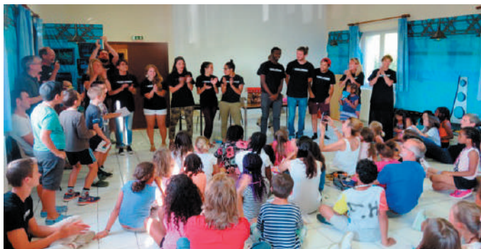
Les moniteurs et monitrices pour 110 enfants