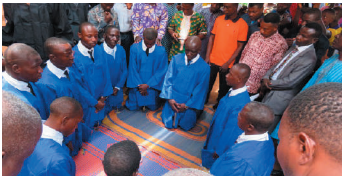
Les étudiants qui reçoivent une bénédiction pour l'avenir