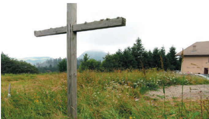
Jésus est au centre de la vie à la Colonie Harmonie

Le Centre Bonnefoi, au cœur des montagnes de l'Ardèche, continue à être une bénédiction comme endroit pour la colonie et pour d'autres activités de l'Église pendant l'année. En juin 2017, il y aura au Centre une semaine de travaux multiples pour faire des réparations et pour améliorer et augmenter les possibilités du bâtiment et des terrains. Chaque année, la colonie est bien remplie et l'inscription pour juillet 2017 devrait commencer bientôt pour avoir une place. Regardez le site pour la Colonie Harmonie au : www. http://centrebonnefoi.free.fr/page6/page6.html